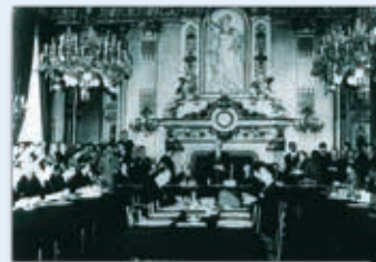
Salon de l'Horloge, Palais du Quai d'Orsay, Paris 09.05.1950