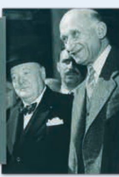
Winston Churchill et Robert Schuman