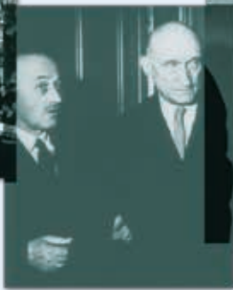
Jean Monnet et Robert Schuman