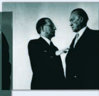
Alcide De Gasperi et Konrad Adenauer