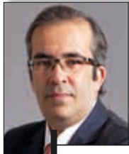
Paulo Rangel Vicepresident Relazioni con i Parlamenti nazionali