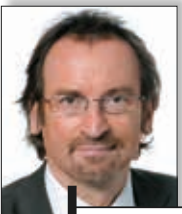
József Szájer Vicepresidente Attività parlamentari