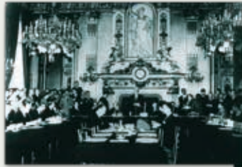
Salone dell'Orologio, Palazzo del Quai d'Orsay, Parigi 09.05.1950