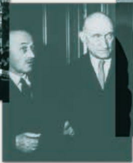
Jean Monnet e Robert Schuman