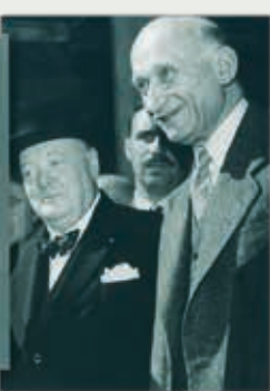
Winston Churchill e Robert Schuman