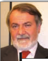
Jaime Mayor Oreja Vicepresidente Strategia politica Rete europea delle idee