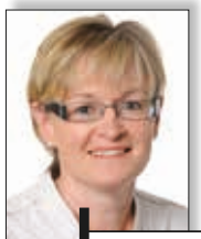
Mairead McGuinness Vicepresidente Gruppo di lavoro 'Affari esteri'