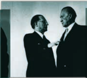
Alcide De Gasperi e Konrad Adenauer