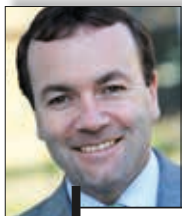
Manfred Weber Vicepresidente Gruppo di lavoro 'Giustizia e Affari Interni' Conciliazione